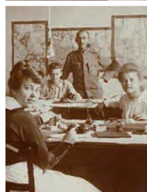
Frauen übernahmen im Krieg die unterschiedlichsten Tätigkeiten, im Bild Frauen als Kriegskrankenschwestern (oben) und in der Schreibstube (unten).